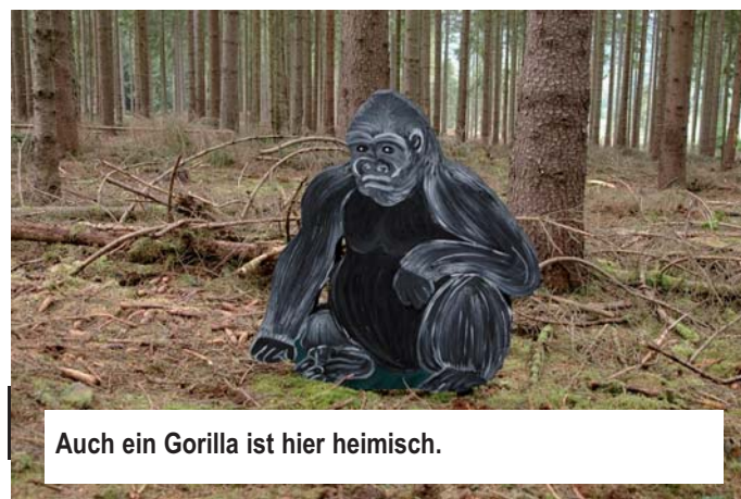
Auch ein Gorilla ist hier heimisch.