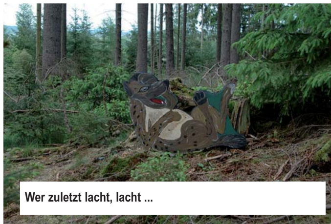
Wer zuletzt lacht, lacht ...