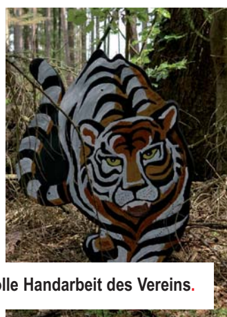
Zwei Beispiele für die liebevolle Handarbeit des Vereins.