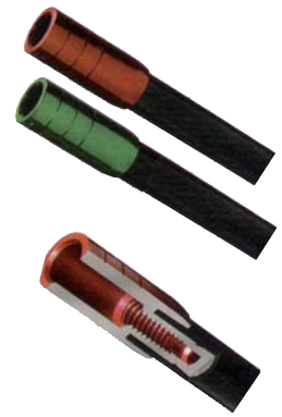
Trophy Ridge Armor Tough Inserts

Die restlichen drei Pfeile unterscheiden sich nur mehr durch ihre Geradheit. Der Blast hat eine Genauigkeit von .002 Zoll, der Hailfire .004 Zoll und der Wrath .006 Zoll. Alle vier Pfeile sind in vier verschiedenen Spinegrößen erhältlich.