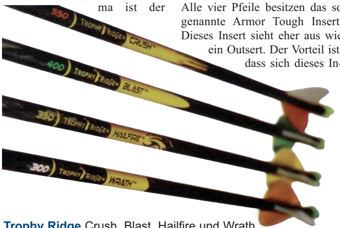
Trophy Ridge Crush, Blast, Hailfire und Wrath

Trophy Ridge ist uns eher im Bereich der Visiere, Pfeilauflagen und Zubehörartikel ein Begriff. Seit heuer stellen sie auch vier verschiedene Pfeile her. Das Flaggschiff der Firma ist der