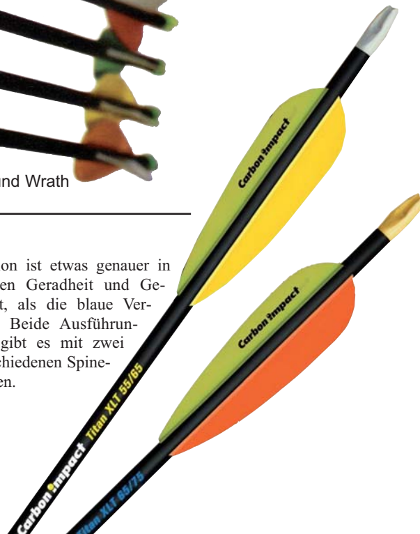
Carbon Impact Titan XLT

Version ist etwas genauer in Sachen Geradheit und Gewicht, als die blaue Version. Beide Ausführungen gibt es mit zwei verschiedenen Spinewerten.