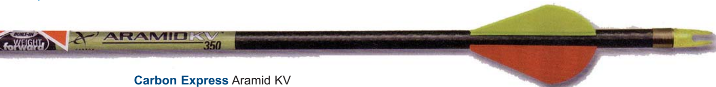
Carbon Express Aramid KV

Eine Übersicht über alle neuen Pfeile der renommierten Hersteller.