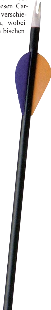
Vapor Pro Series

Die Firma Vapor gehört zu Goldtip und bietet drei Pfeilserien und einen Armbrustpfeil an. Die Toplinie von Vapor ist die Vapor Pro Series. Die Pfeile dieser Serie sind entweder in Schwarz oder Camo erhältlich. Diesen Carbonpfeil gibt es drei verschiedenen Spinegrößen, wobei die Camoversion ein bisschen schwerer ist.