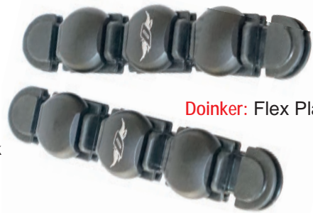
Doinker: Flex Plates