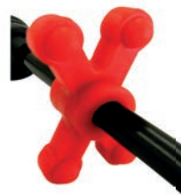
Bowjax: Big Jax