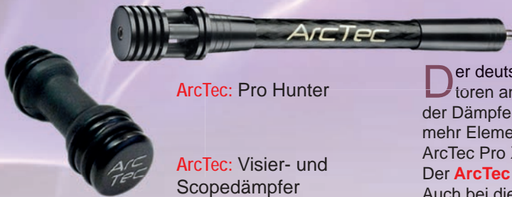
ArcTec: Pro Hunter