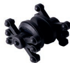
Bowjax: Limb Jax