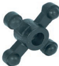
Bowjax: Max Jax