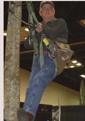
Nebenjob: Drei Tage hing der gute Mann zur Demonstration am Baum.