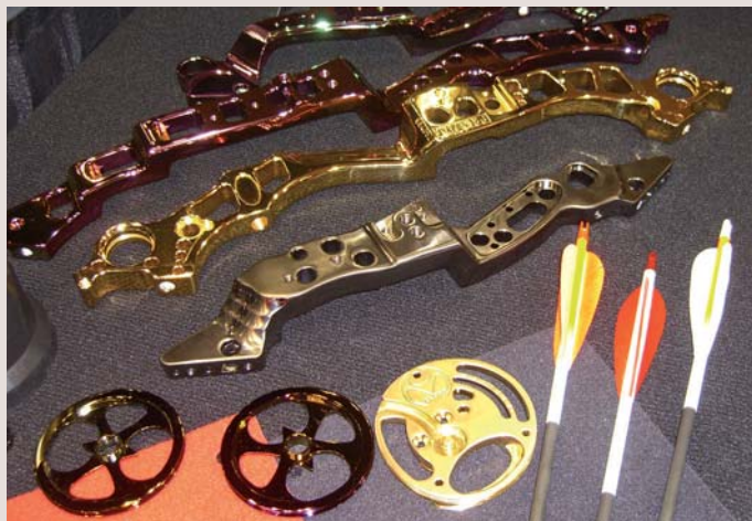
Pimp your bow: Für den „ausgefallenen“ Geschmack. Bögen mit Flip-Flop-Farben.