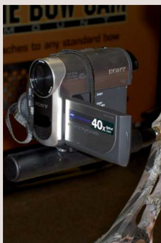
Jagd mit der Kamera: Sie ist gleich am Bogen montiert; schwingungsgedämpft für ein ruhiges Bild.