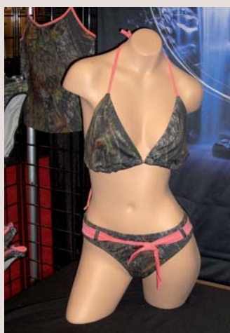
Sex sells: Für die Dame des Waidmannes für untendrunter.