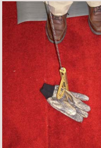
Aufheben leicht gemacht: Für Jäger am Treestand.