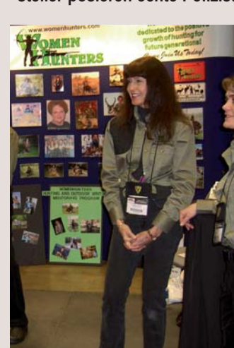
Gleichberechtigung auf amerikanisch: Frauen haben ihren eigenen Jagdverband.