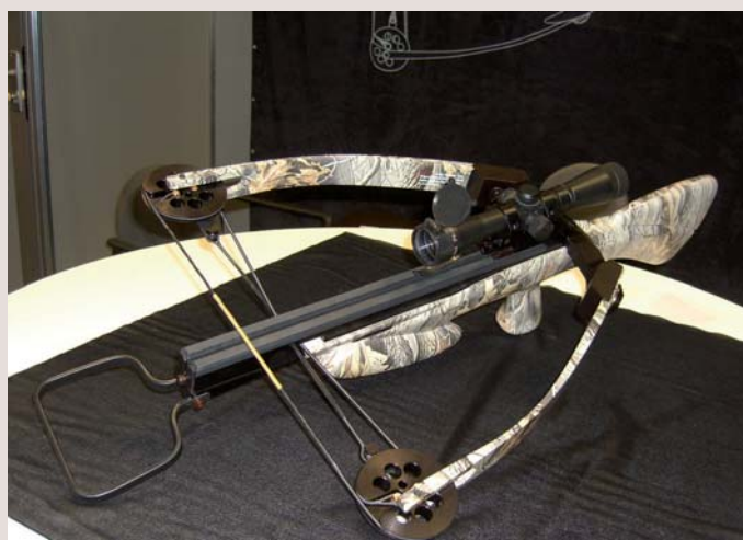
Armbrust mal andersrum.