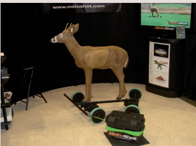
Bewegliche Scheibe: An einer Leine läuft die Scheibe in einem beliebigen Radius im Kreis.