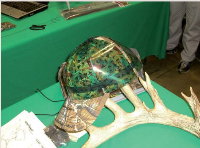
Jagdkappe mit klebrigem Überzug zum Anlocken von Insekten.