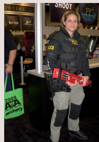
Marketing: Für einen Pfeilhersteller posieren echte Polizisten.