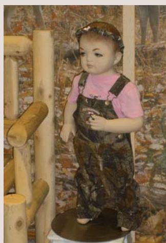
Jagdlieh auch die Kids.